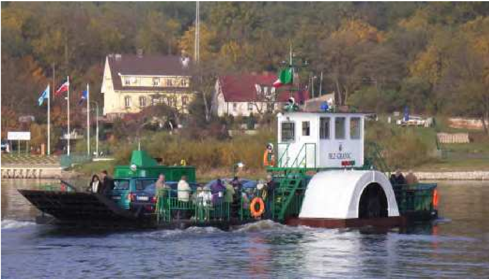
Neue Fähre BEZ GRANIC – OHNE GRENZEN auf der Fahrt über die Oder bei Gozdowice / Güstebieser Loose